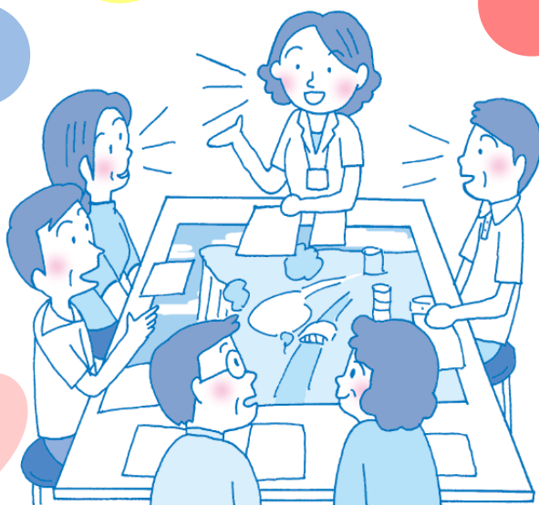
イラスト：小林ちか子

糖尿病カンバセーション・マップは、糖尿病のある人がグループになり、医療者のファシリテーションのもと、糖尿病の知識や体験を話し合い、お互いに学びあう新しい糖尿病教育資材です。